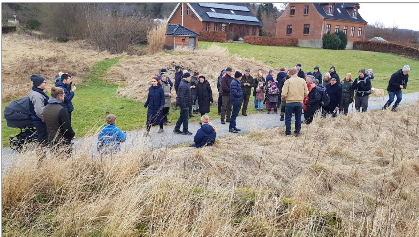
Naturgruppen ved Thisted mejeri