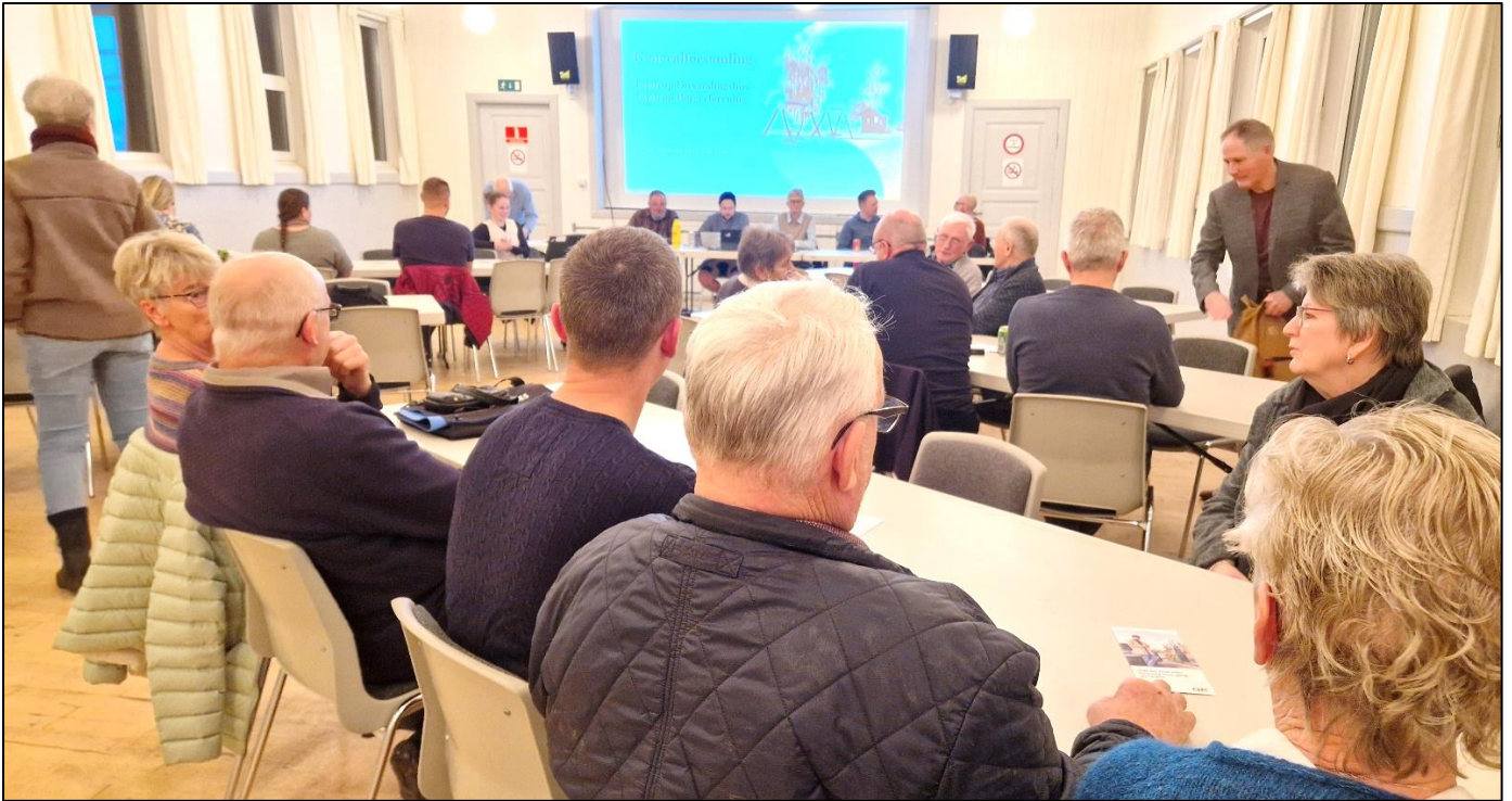
Billede fra generalforsamling i Tapdrup Forsamlingshus d. 26 februar 2026.