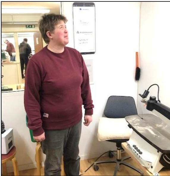
En lille pause i arbejdet.