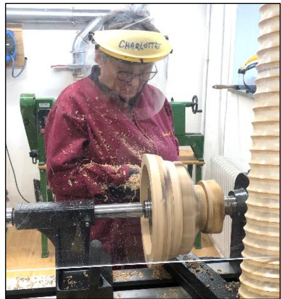
Arbejde ved drejebænken