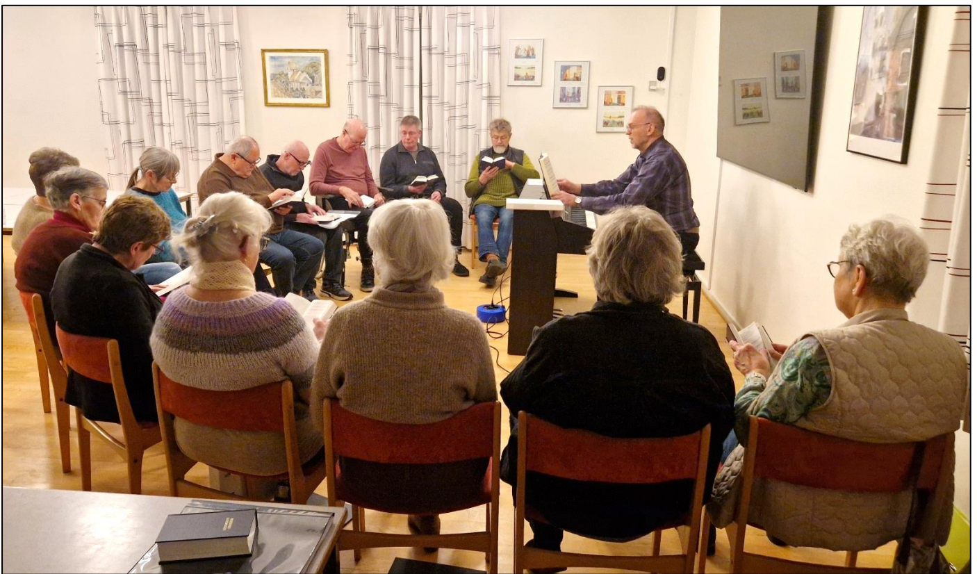
Billede fra Tapdrupkorets øveaften.