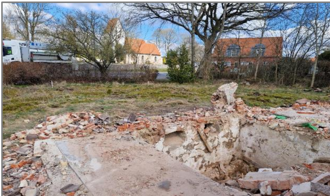
Resterne af Stationsvej 1

Frist for indlevering af bidrag til næste nummer af Tappen er den 25. august 2023.