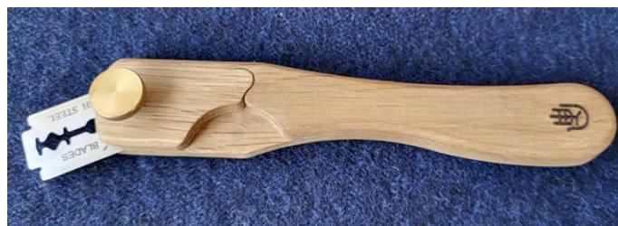
Ridsekniv til surdejsbagning