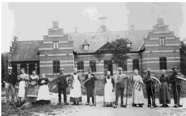
Et gammelt høstbillede fra Skovsgård o. år 1900.