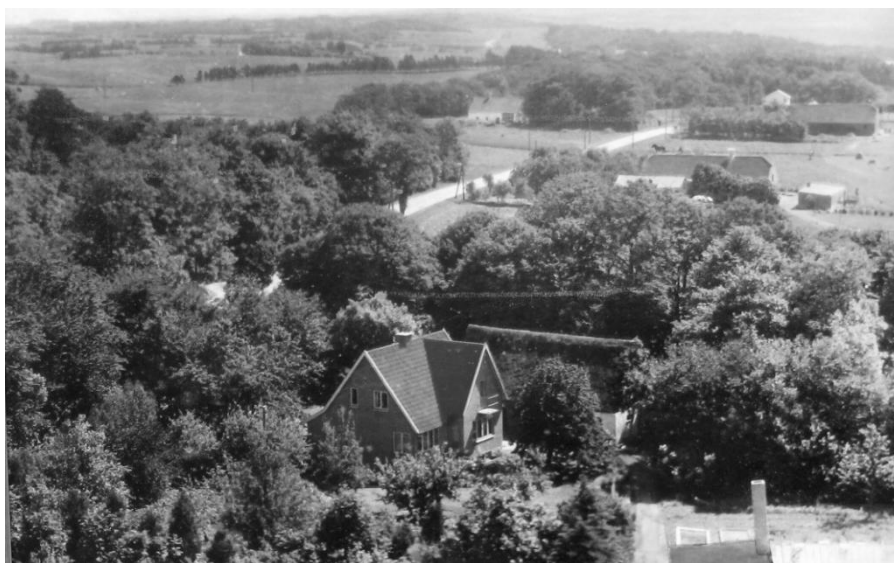
Det nuværende gartneri